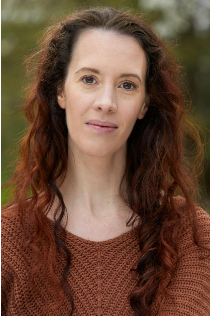
Portrait par Marie-Hélène Tercats