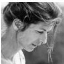
Michel Torrekens Écrit