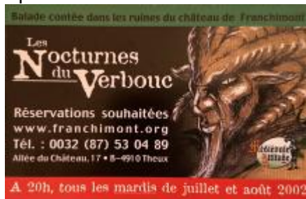
Les Nocturnes du Verbouc