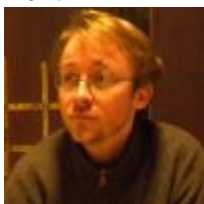
François Salmon Écrit