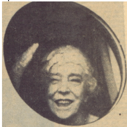
La Reine Rouge