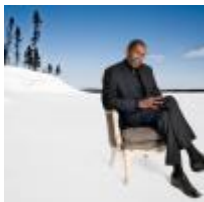
Victoire de Changy Écrit