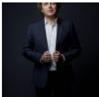
Frédéric Young Spectacle vivant Son Écrit Audiovisuel