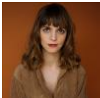
Kitty Crowther Écrit