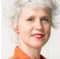
Alex Vizorek Son Spectacle vivant Écrit Audiovisuel