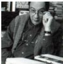
Alain Berenboom Écrit