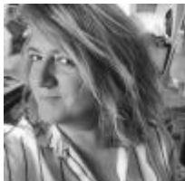
Myriam Dahman Écrit