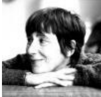
Thomas Lavachery Écrit