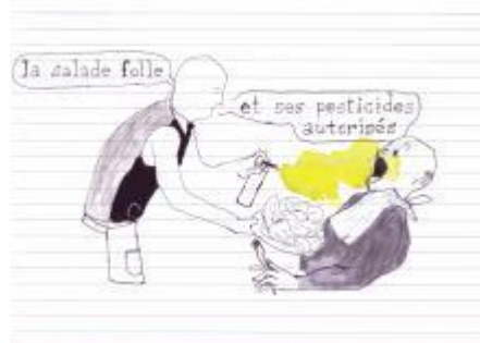
Illustration pour Kairos, n°45, "Empoisonnements éco-responsables", p. 4, juin- juillet- août 2020