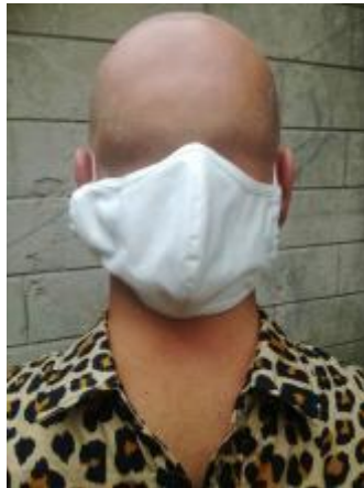
Photographie pour l'article "L'individualiste insoumis", in Kairos, n° 46, septembre/octobre 2020