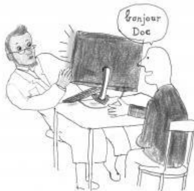
Illustration pour Kairos, n°43, "Grève des données", p. 13, février - mars 2020