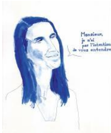
Dessin de couverture pour Kairos, n° 46, septembre/octobre 2020