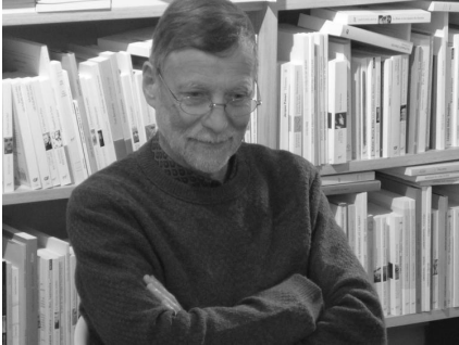
Photo prise à la librairie Point Virgule à Namur