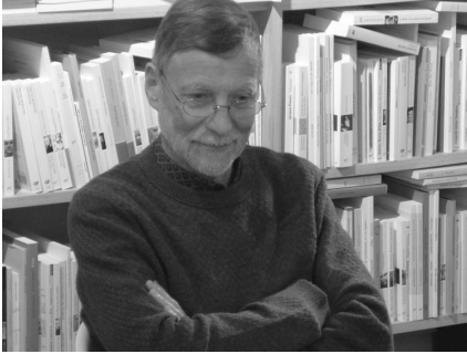
Photo prise à la librairie Point Virgule à Namur