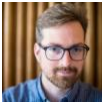
Peter Ninane Audiovisuel