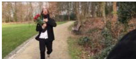
C'était un rendez-vous