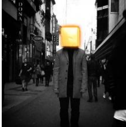
Metroland – Cube (small)