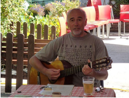
Troubadour de Bouillon