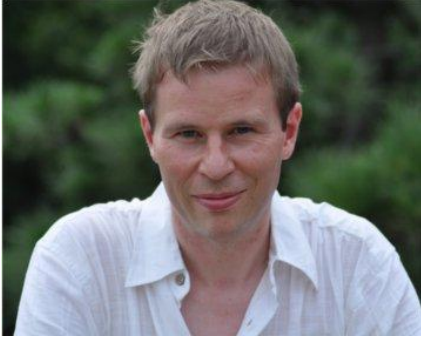
profil de l'auteur