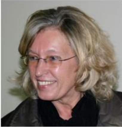
profil de l'auteur