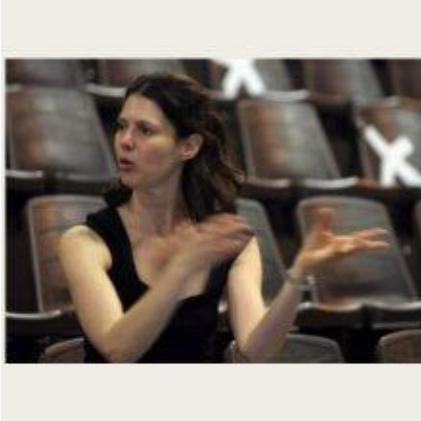
profil de l'auteur