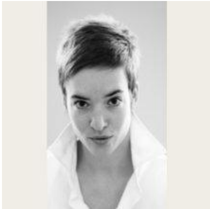
profil de l'auteur