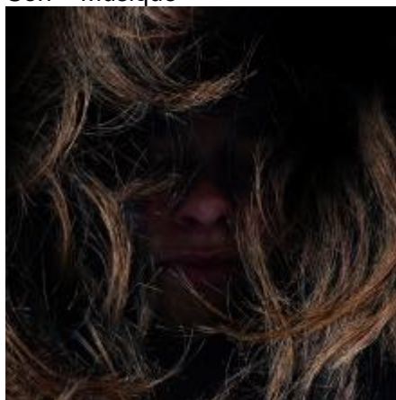
The Magma Chamber OST