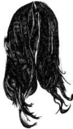
La fin des pseudonymes