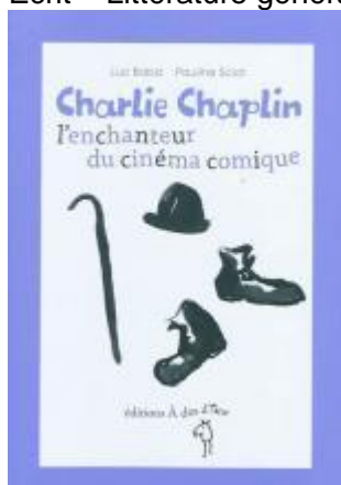
Charlie Chaplin, l'enchanteur du cinéma comique