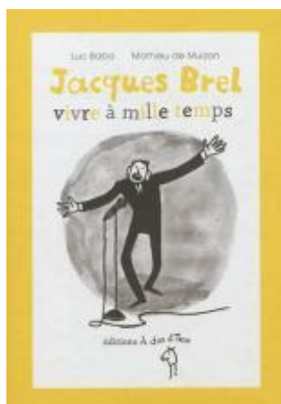
Jacques Brel, vivre à mille temps