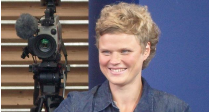
profil de l'auteur