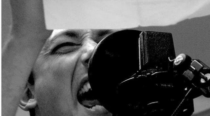
profil de l'auteur