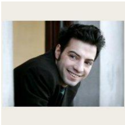
profil de l'auteur