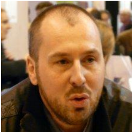
profil de l'auteur