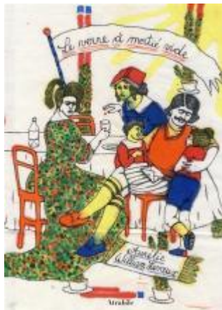
Le verre à moitié vide