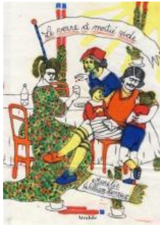
Le verre à moitié vide