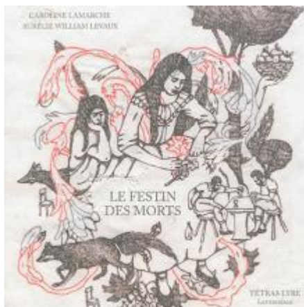
Le festin des morts