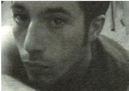
Photo de couverture du livre "Petite chronique du désir" d'André Séguy (alias Arnaud Querec)