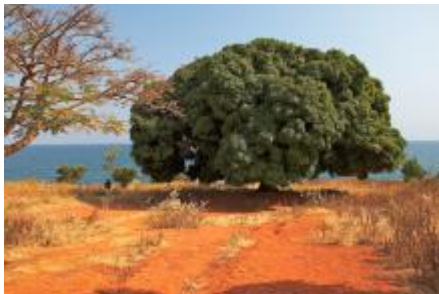
Photo de couverture du livre "Aux coins des mondes"