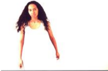
Photo de couverture du livre "Corps insulaires" de Véronique Goavec