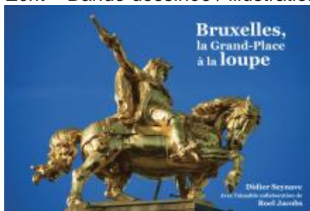
Photo de couverture du "beau livre" "Bruxelles, la Grand-Place à la loupe"