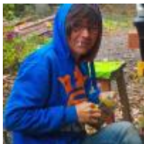
Marie Baudet Écrit