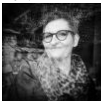
Vinciane Despret Écrit