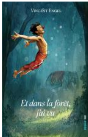
Et dans la forêt, j'ai vu