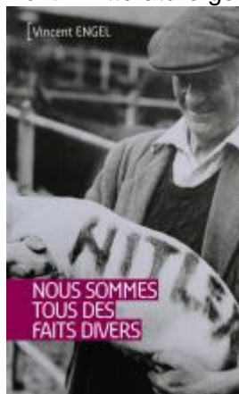
Nous sommes tous des faits divers