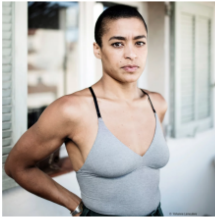
Nach : Autour du squelette Krump