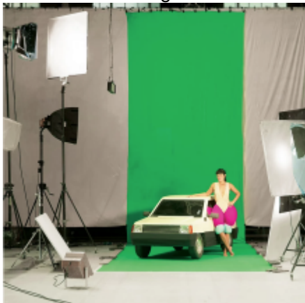
Le périmètre de Vimala