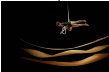
Corps - papier - cirque