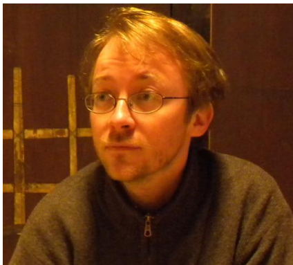
profil de l'auteur