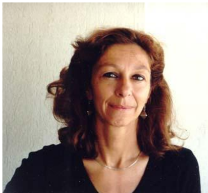
profil de l'auteur