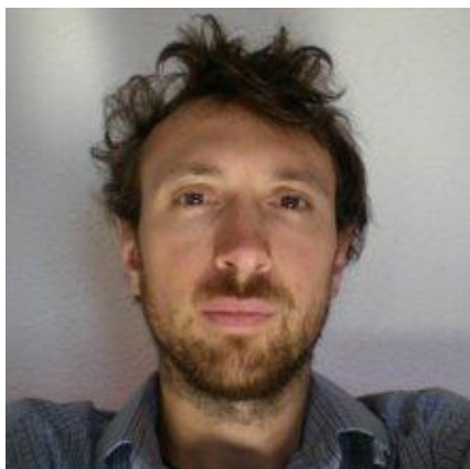
profil de l'auteur