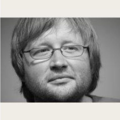
profil de l'auteur