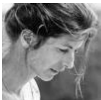
François Schuiten Écrit Audiovisuel