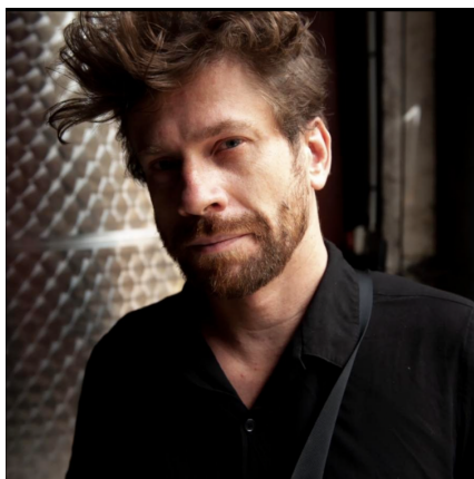
Profil de l'auteur