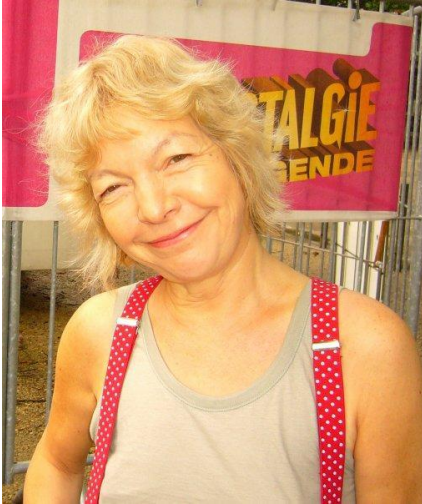
profil de l'auteur