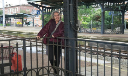
par Alice Piemme