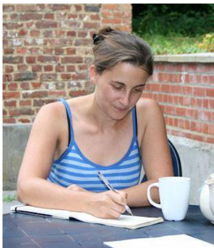
profil de l'auteur