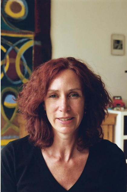
profil de l'auteur