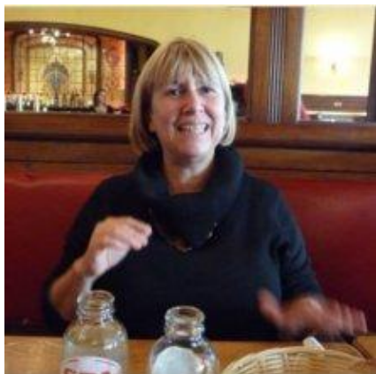
profil de l'auteur