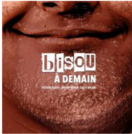
Bisou à demain