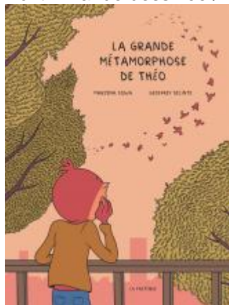
La grande métamorphose de Théo