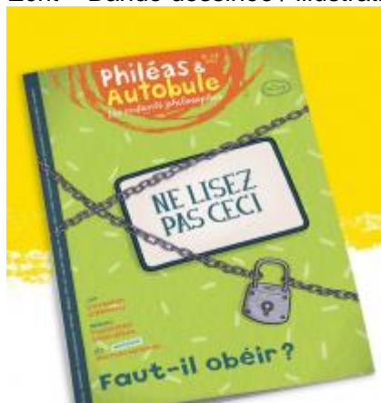
Philéas & Autobule 2019