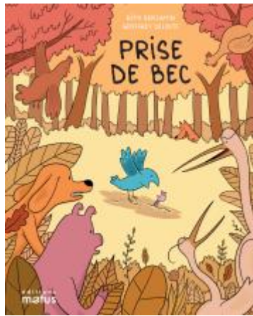
Prise de bec