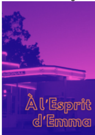
À l'Esprit d'Emma