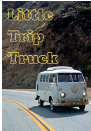
Little Trip Truck