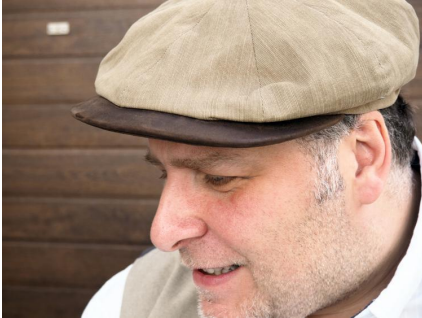
Sifiane retraite artistique à Nijar