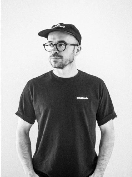
Jérémy Parotte - Réalisateur