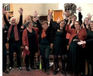
La bande des Melting Potes.